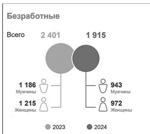
Рис. 2. Безработные и уровень безработицы. Росстат. Россия 2025. Статистический справочник

5.3. Сформулируйте, что такое безработица? Назовите 2 позитивных и 2 негативных последствия безработицы, обоснуйте их.